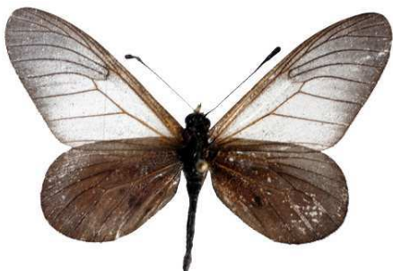
cinerea femelle, Kalinzu fst (Ouganda).jpg cinerea