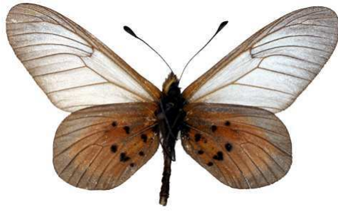
cinerea mâle verso, Nyungwe forest (Ruanda).jpg luluae