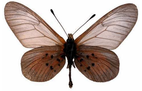
cinerea mâle verso (Ruanda).jpg luluae