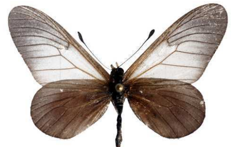
cinerea mâle 2, Kalinzu fst (Ouganda).jpg cinerea