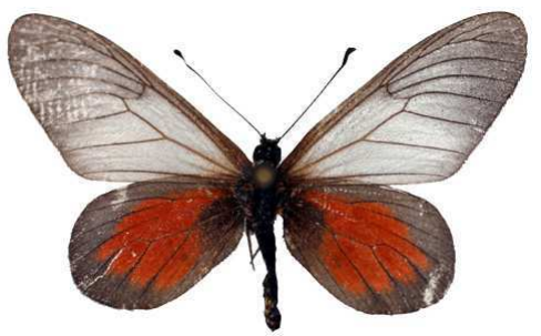
cinerea mâle, Kivu (Zaire) Vingerhoedt.jpg luluae