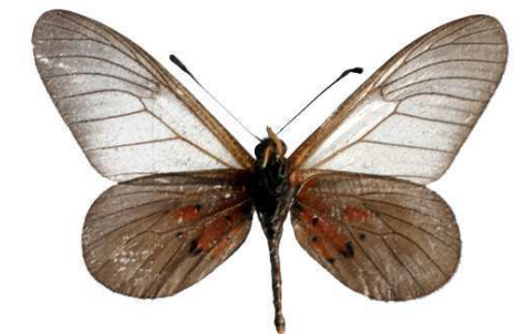
cinerea femelle verso, Kalinzu fst (Ouganda).jpg cinerea