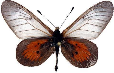
cinerea mâle (Ruanda).jpg luluae