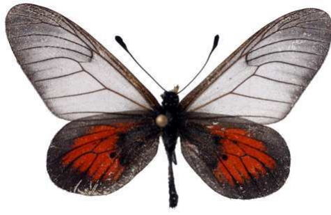
cinerea, Kasuo - Kivu (Zaire) Ducarme 38.JPG luluae