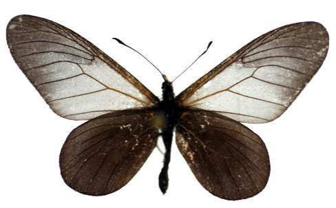
cinerea, Kakamega ft, Kenya ouest MNHN (Cat EB).jpg cinerea