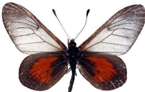
cinerea femelle, Kivu - Kaluzi (R.D. Congo).jpg luluae