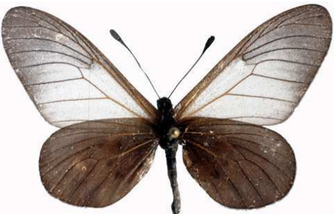
cinerea mâle, Kalinzu fst (Ouganda).jpg cinerea