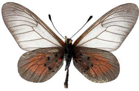
cinerea, verso, Kasuo - Kivu (Zaire) Ducarme 38.JPG luluae