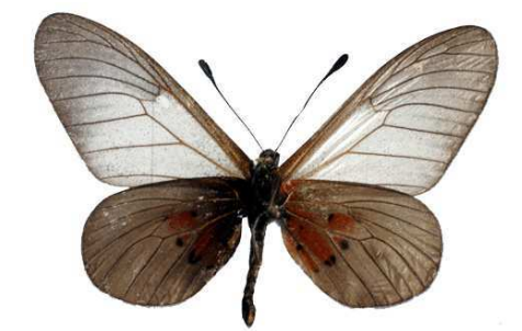
cinerea mâle verso, Kalinzu fst (Ouganda).jpg cinerea