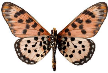
chilo, verso, Magadi (Kenya) 58.JPG chilo