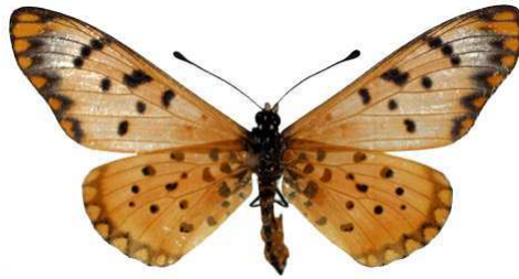
chilo femelle 1 (Cat EB).jpg chilo