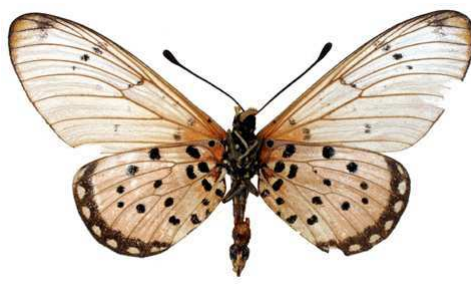
chilo femelle, verso, Magadi road (Kenya).jpg chilo