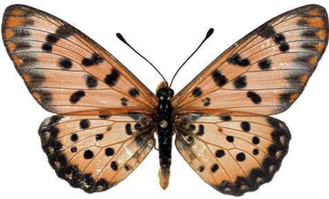
chilo mâle, Shimba hills (Kenya).jpg chilo