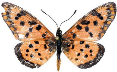
chilo mâle, Wadi Hannah Al Udayin (Yemen).jpg chilo