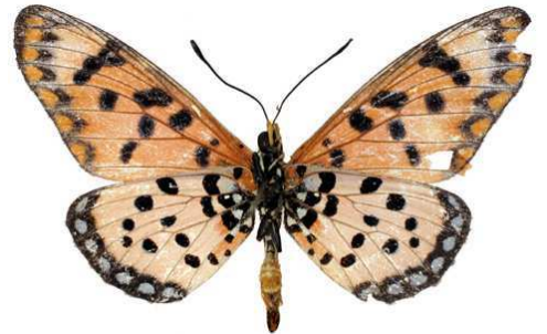
chilo mâle, verso, Wadi Hannah Al Udayin (Yemen).jpg chilo