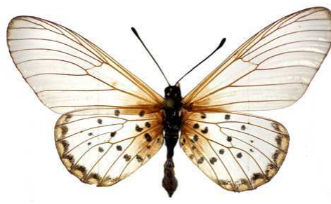
chilo, forme femelle crystallina, Taru, Kenya MNHN (Cat EB).jpg crystallina