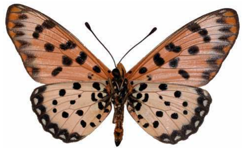
chilo mâle, verso, Shimba hills (Kenya).jpg chilo