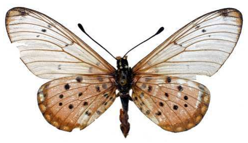
chilo femelle, Magadi road (Kenya).jpg chilo