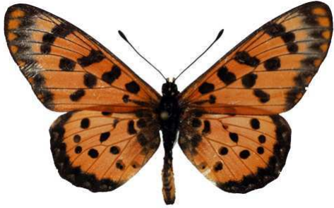
chilo mâle 1 (Cat EB).jpg chilo