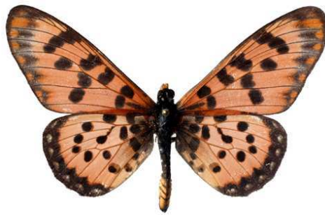
chilo, Magadi (Kenya) 58.JPG chilo