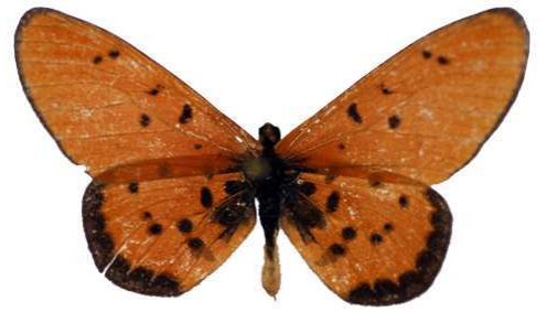
chambezi, Ipumba, Mpanda, Tanzanie MNHN (Cat EB).jpg chambezi