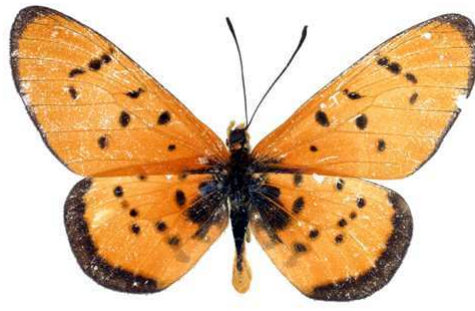
chambezi, mâle, recto, Ipomba - Mpanda, Tanzanie, 45.JPG chambezi