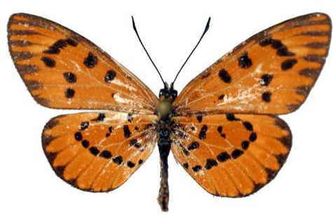
calida femelle, Ambehimabazo (Madagascar) 11- 72 Cat EB Bernaud.jpg calida