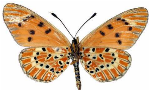
calida femelle verso (Madagascar).jpg calida