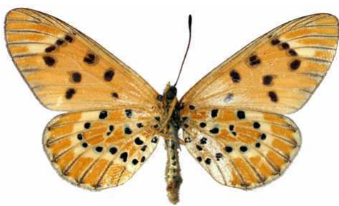
calida femelle 2 verso (Madagascar).jpg calida