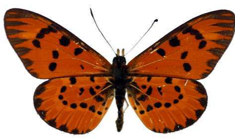
calida, Tananarive, Madagascar MNHN (Cat EB).jpg calida