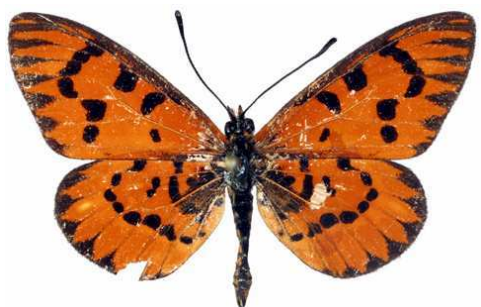
calida mâle, Ambohimahazo (Madagascar).jpg calida