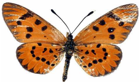
calida femelle (Madagascar).jpg calida