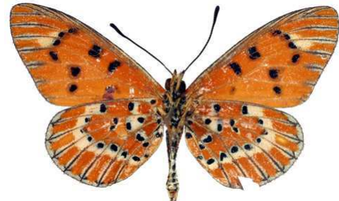
calida mâle verso, Ambohimahazo (Madagascar).jpg calida