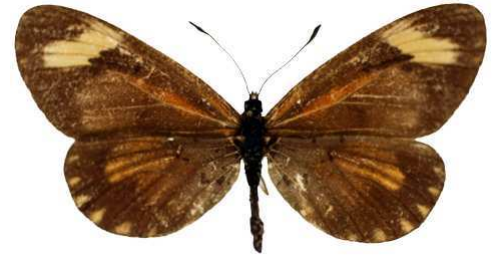
burgessi, femelle, Rutenga ft, Kigezi, Uganda MNHN (Cat EB).jpg burgessi