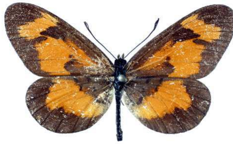
burgessi, mâle, recto, Mafuga fst, Ouganda, 42.JPG burgessi