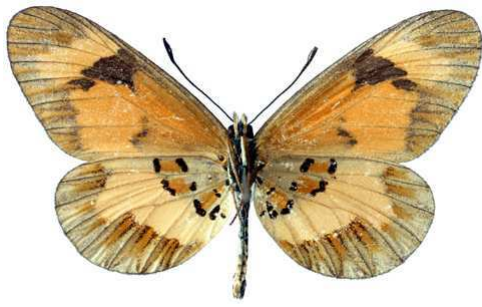
burgessi, mâle, verso, Mafuga fst, Ouganda, 42.JPG burgessi