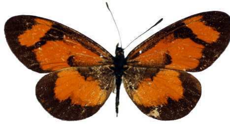
burgessi, Rutenga ft, Kigezi, Uganda MNHN (Cat EB).jpg burgessi