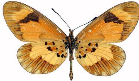
burgessi mâle verso, Mafuga (Ouganda).jpg burgessi