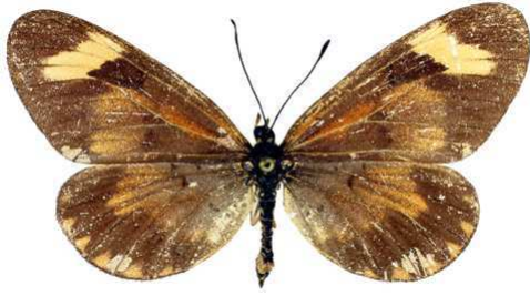
burgessi, femelle, recto, Mafuga fst, Ouganda, 48.JPG burgessi