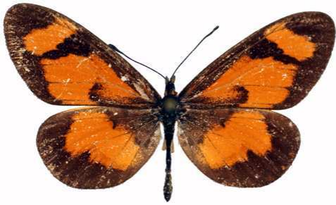
burgessi mâle, Mafuga (Ouganda).jpg burgessi