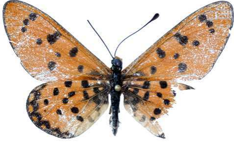
brainei, Hartman's valley (Namibie) Collins 46.JPG brainei