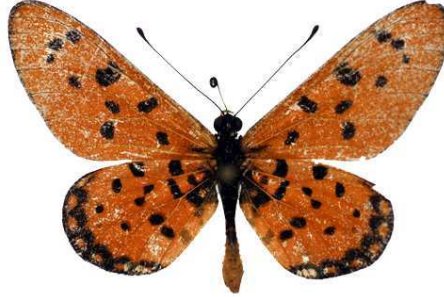
brainei, Hartmanns valley, Kaokoland, Namibie MNHN (Cat EB).jpg brainei