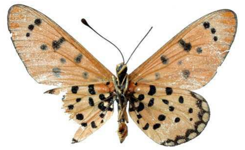
brainei, verso, Hartman's valley (Namibie) Collins 46.JPG brainei