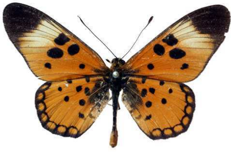
bellona mâle, Upper Cunene - Cubango (Angola).jpg bellona