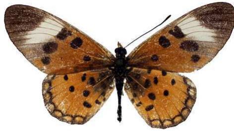
bellona, femelle, Capelongo, mission Rohan- Chabot, Angola MNHN (Cat EB).jpg bellona