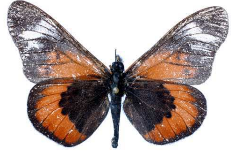
oldeani, oldeani mt (Tanzanie) Kielland 50.JPG oldeani