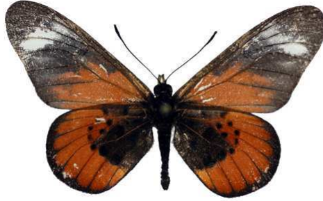
baxteri baxteri, Longido, Tanzanie MNHN (Cat EB).jpg baxteri