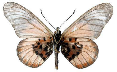
baxteri, verso, Nguru - Mambiga (Tanzanie) Kielland 47.JPG baxteri