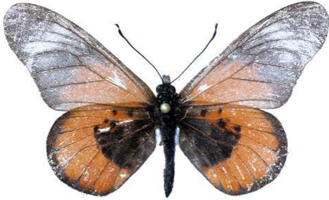
baxteri, Nguru - Mambiga (Tanzanie) Kielland 47.JPG baxteri