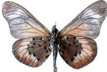
oldeani, verso, oldeani mt (Tanzanie) Kielland 50.JPG oldeani