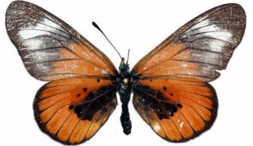
baxteri femelle, SE - bord du lac Malawi (Tanzanie).jpg baxteri