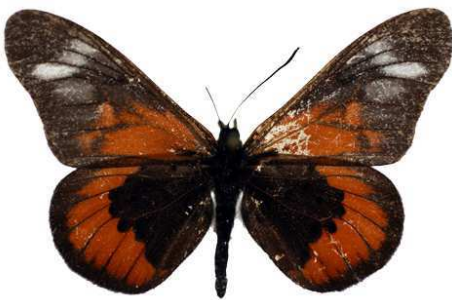
baxteri oldeani, Oldeani, Tanzanie MNHN (Cat EB).jpg oldeani