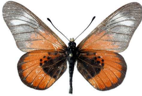
baxteri, mâle, recto, Komboka mts, Tanzanie, 53.JPG baxteri