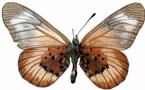
baxteri femelle verso, SE - bord du lac Malawi (Tanzanie).jpg baxteri