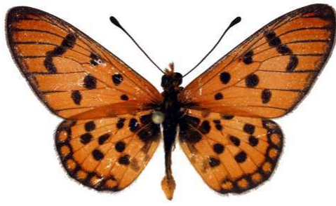
bailunduensis mâle, Kapanga (R.D. Congo).JPG bailunduensis