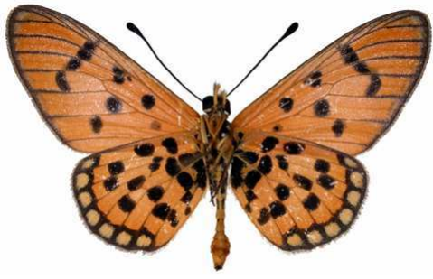
bailunduensis mâle, verso, Kapanga (R.D. Congo).JPG bailunduensis